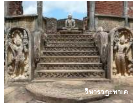
วิหารวฤชทาเค

☉ รับประทานอาหารกลางวันที่ภัตตาคาร นำท่านเดินทางสู่ เมืองโปโลนนารูวะ (Polonnaruwa) เมืองหลวงแห่งที่ 2 ของศรีลังกา เมืองโปโลนนารูวะแห่งนี้ตั้งขึ้นโดยชาวโจฬะในกองทัพของพระเจ้าราชาที่ 1 จากอินเดียตอนใต้ ได้ยกทัพมายึดเมืองอนูราชปุระ แล้วย้ายราชธานีมาอยู่ที่แห่งนี้ในปี พ.ศ. 1560 ทำให้ในเมืองโปโลนนารูวะ จึงมีเทวาลัยสร้างถวายพระอิศวรในศิลปะโจฬะปรากฏอยู่ ชม พระราชวังโบราณ แล้วชม วิหารวฤชทาเค อันงดงามยิ่ง สร้างในราวพุทธศักราชที่ 12 ก่อสร้างก่อนเมืองโปโลนนารูวะหลายร้อยปี ชม มุนสโตน ทุ่งดงามและสมบูรณ์ที่สุดซึ่งเคยเป็นพระอารามหลวงและเป็นที่ประดิษฐานพระเขี้ยวแก้วในสมัยโปโลนนารูวะจากนั้นนำชม พระพุทธรูป 4 องค์ แห่งวิหารคัล ที่ล้วนมีความสวยงาม ซึ่งสร้างความประทับใจแก่ผู้มาเยือน