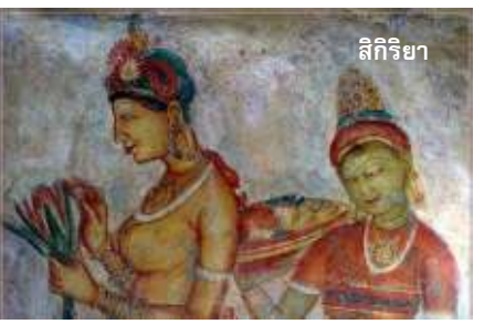
สิกิริยา