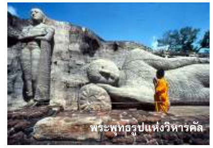
พระพุทธรูปแห่งวิหารคัล